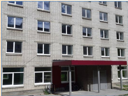
Общежитие Кутузова, 11