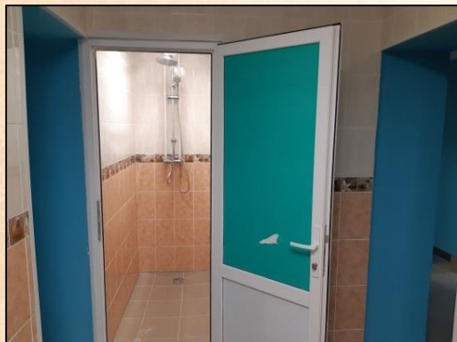
Общежитие Мурманская, 28