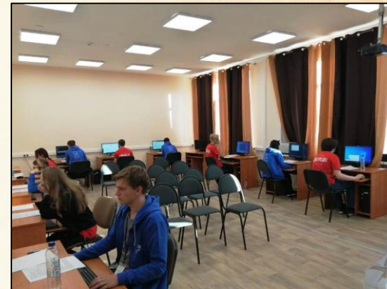
Программные решения для бизнеса