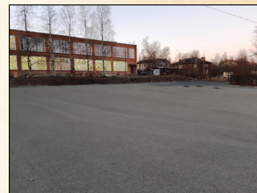
Мастерские и площадка, пр. Первомайский, д. 56