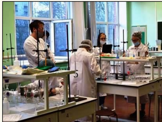
Лабораторный химический анализ