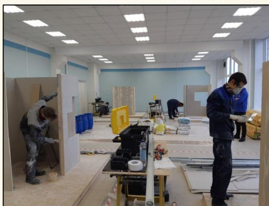
Сухое строительство и штукатурные работы