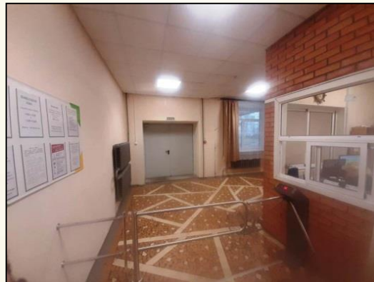
Общежитие Кутузова, 11