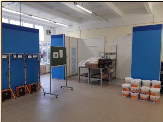
Малярные и декоративные работы