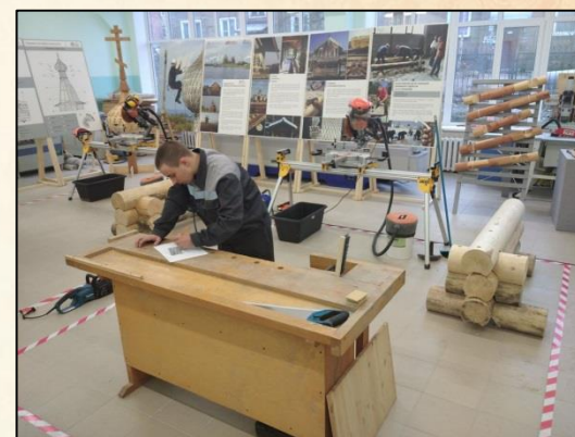
Реставрация памятников деревянного зодчества