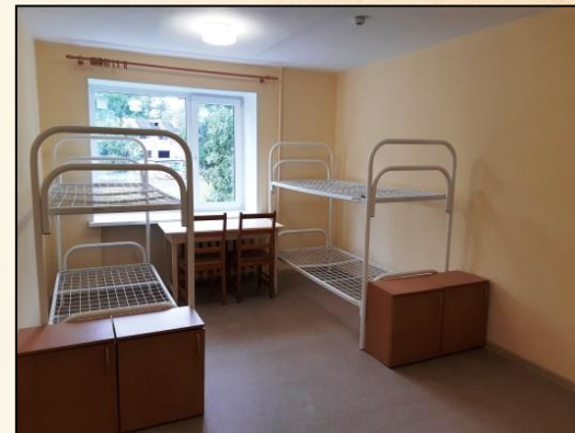
Общежитие Мурманская, 28